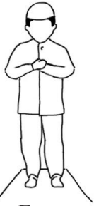
Гьям (Положение стоя)